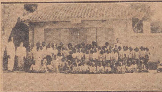
Kinderen van het J. L. Korps te Djocja.

„Ik geloof vast en zeker dat je Moeder van uit den Hemel toeziet hoe deze viering