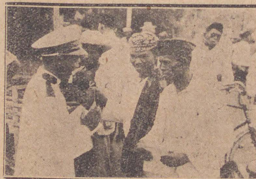
Kadetten op huisbezoek.

Vervolgens richt de Kommandant zich tot de Kadetten en spreekt tot hen naar aanleiding van de geschiedenis der genezing van den kreupele door Petrus en Johannes. „Uw Godsvetrouwen zal in daden worden omgezet. Houdt de Vlag van het Leger hoog. Houdt de beginselen hoog. Weest