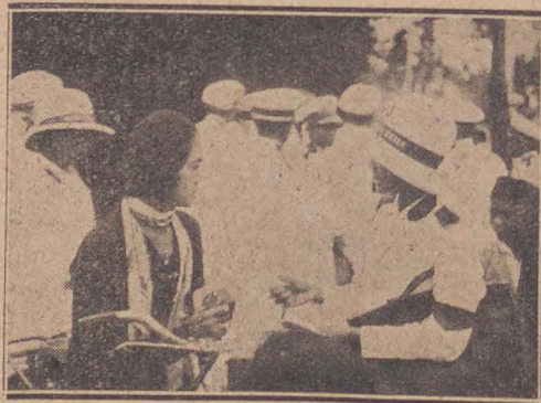
Kadetten op huisbezoek.