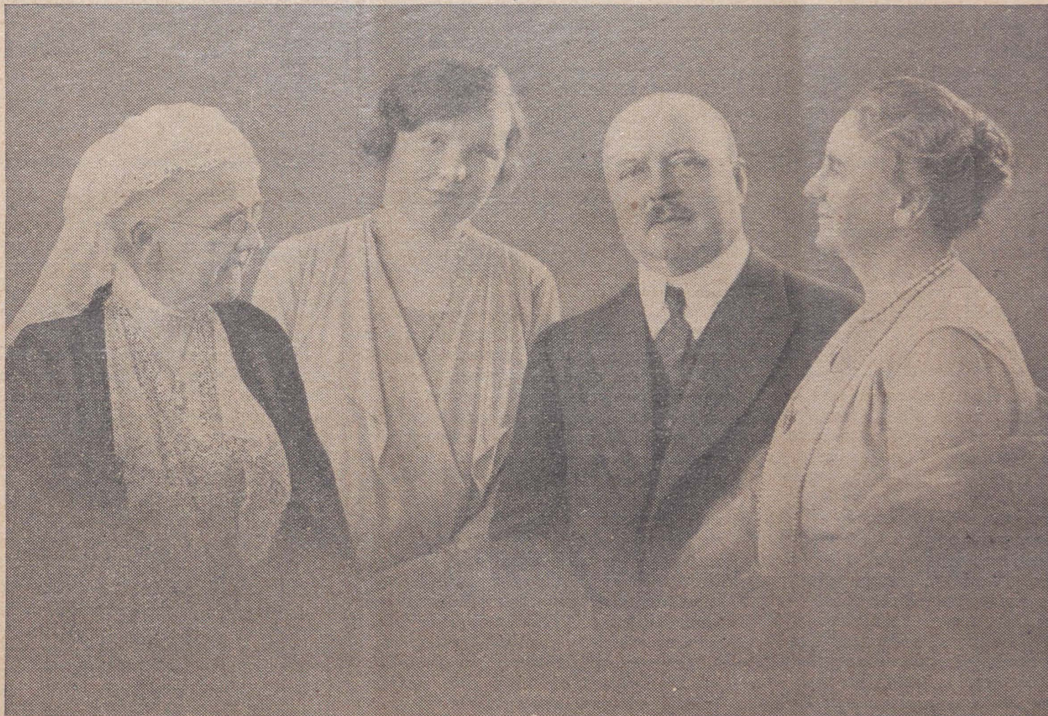
Zeer getroffen zijn we allen door het feit, dat in zulk een korten tijd twee leden zijn weggenomen uit den huiselijken kring van vier die zoo innig aan elkander verbonden waren.