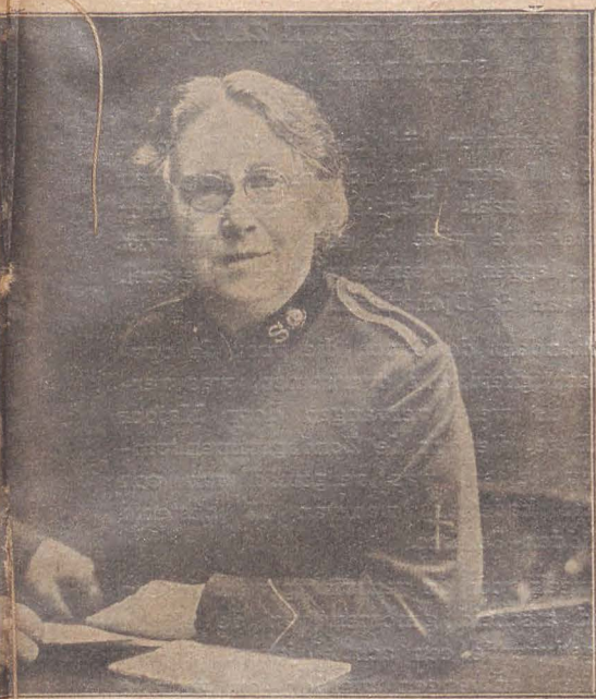
Higgins. — God zegene hen!

Mogen wij er toe geleid worden ze aan Hem af te staan.